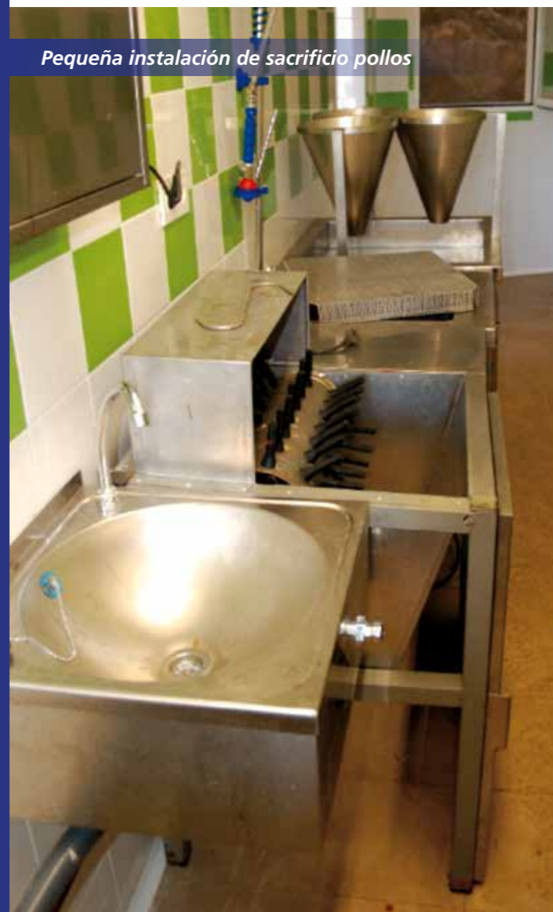
Pequeña instalación de sacrificio pollos

De la misma forma, la norma establece las pautas de higiene a los pequeños productores primarios para favorecer el consumo de proximidad y los canales cortos de comercialización. Se permite la venta directa de pequeñas cantidades de carne a consumidores y consumidoras o a establecimientos de venta al por menor, que podrá realizarse en la propia explotación o en mercados ocasionales o periódicos. La distancia entre la explotación y los mercados o establecimientos no puede superar los 100 kilómetros.