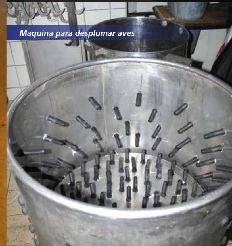
Maquina para desplumar aves