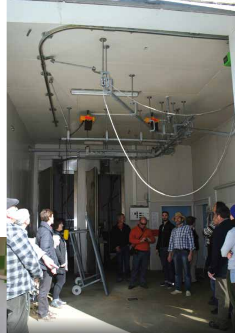
Matadero en la explotación en Austria