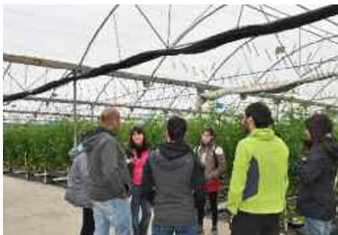
Zero hondakin proiektuko hidroponiko ustiatagia

«Kanarietan ikusi ta ezautu doguna aberasgarria izan da baina hori baino gehiago aportatu digu (gure) esperientzien elkartrukaketak. Nire ustez. Eutzi goixeri Agro power!»