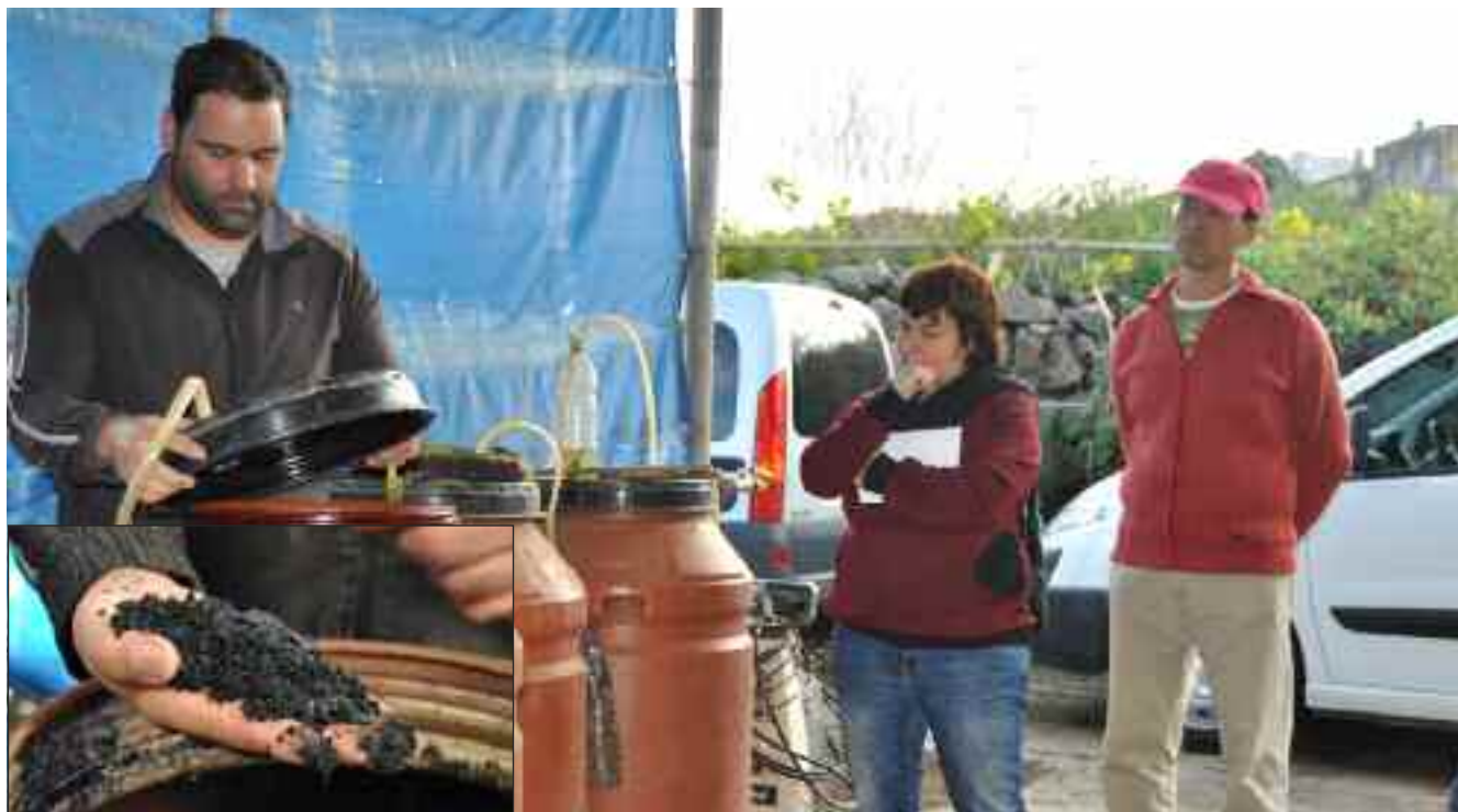
Cesarren mikroorganismo infusioak eta konposta.

Elkartrukean parte hartu duten delegatuei iritzia eskatu diegu, hemen beraien adierazpenak