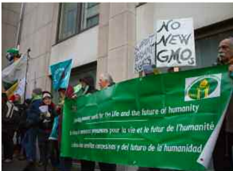
imagen de la movilización tras asamblea de ECVC del 2018

Este año, y teniendo en cuenta la reforma de la PAC, uno de los temas centrales de la asamblea serán las propuestas que desde el ámbito campesino se consideran necesarias para garantizar que la política agraria comunitaria de respuesta a las demandas y necesidades campesinas. Además de este tema, y relacionado, se hablará sobre las estrategias para implementar la declaración de Derechos Campesinos recientemente aprobada por la Asamblea de la ONU.