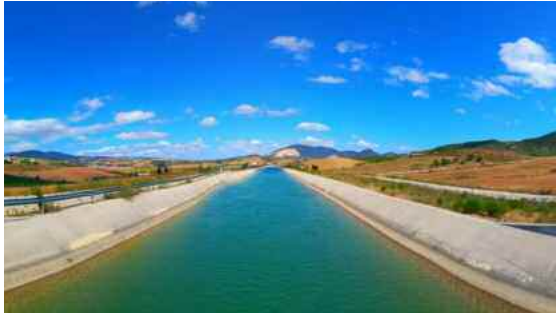
Nafarroako Kanala, Pitillasen.

"Nafarroako eta Espainiako gobernuek Itoitz-Nafarroako Kanala