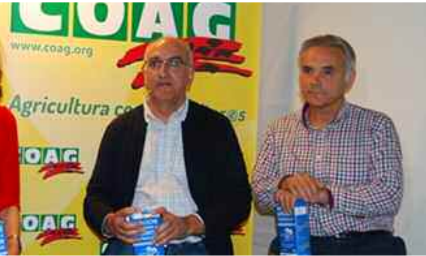
Momento de la presentación en la Vaquería Montañesa, Madrid

dora. Nuestra realidad tiene que cambiar y con este tipo de iniciativas se pueden posibilitar muchos cambios replicables al resto de producciones agrarias”.