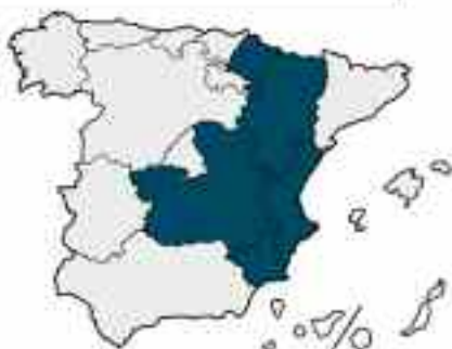
Mapa 1: Comunidades autónomas en las que se ha incrementado más de un 90% la producción de leche entre los años 2000 y 2017.