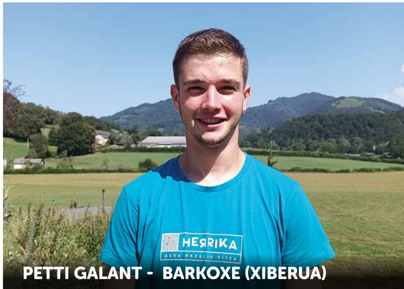
PETTI GALANT - BARKOXE (XIBERUA)