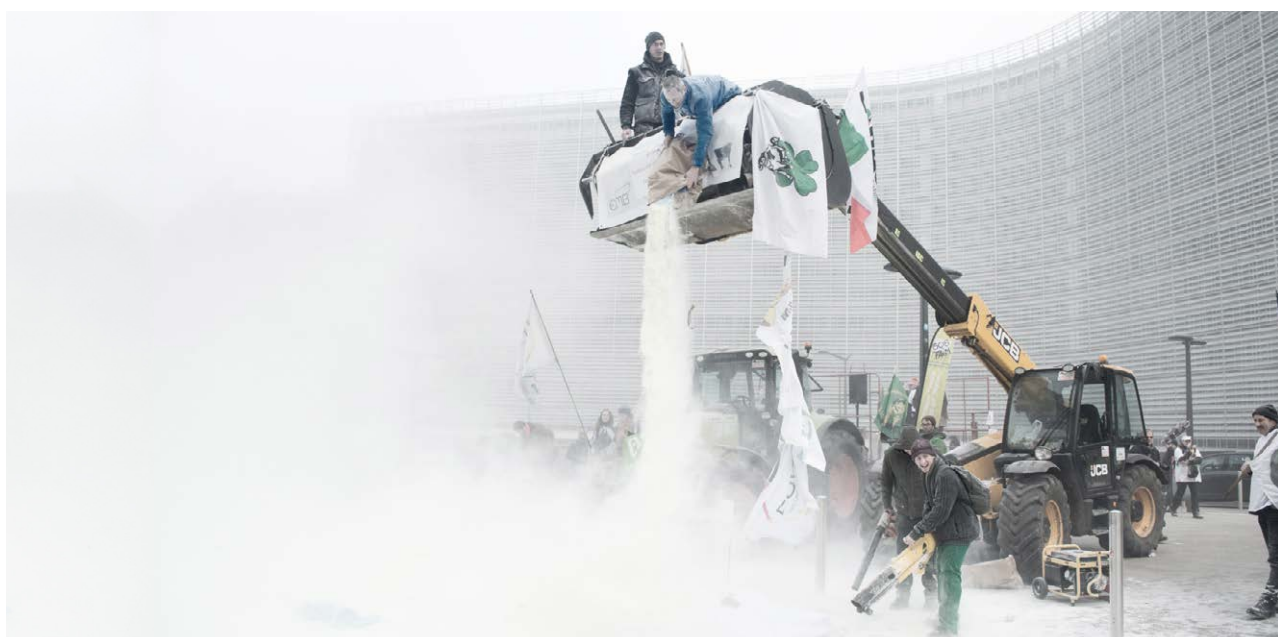
Acción leche en enero de 2017 ante la Comisión de la UE para protestar contra el fin de cuotas lácteas