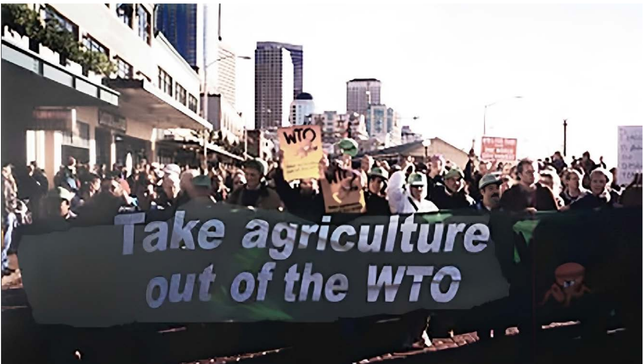
La Via Campesina, Seattle, 1999

Desde los años 90, los movimientos campesinos y las organizaciones de la sociedad civil han expresado muchas críticas sobre este modelo y han denunciado las consecuencias negativas que tiene a nivel social y medioambiental. 8