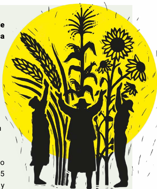
Soberanía alimentaria

La soberanía alimentaria también está reconocida en el derecho internacional. Su definición se encuentra en el preámbulo y el artículo 15 de la Declaración de las Naciones Unidas sobre Derechos Campesinos y otras personas que trabajan en las zonas rurales (UNDROP)