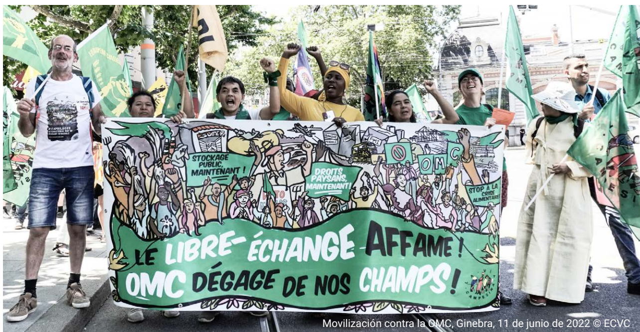
Movilización contra la OMC, Ginebra, 11 de junio de 2022

Constituir reservas para garantizar el suministro alimentario es una de las principales funciones de los estados desde su creación, una práctica que, sin embargo, es ilegal según las reglas de la OMC. Siguiendo los ejemplos de los países asiáticos y sobre todo el de la India, que hemos mencionado al inicio de este apartado, es fundamental que la Unión Europea constituya unas reservas públicas. Las importantes fluctuaciones de precio de estos últimos meses, pero también a largo plazo, ilustran que esta especulación tiene consecuencias tanto para los campesinos y campesinas como para toda la sociedad, sobre todo para las personas más pobres.