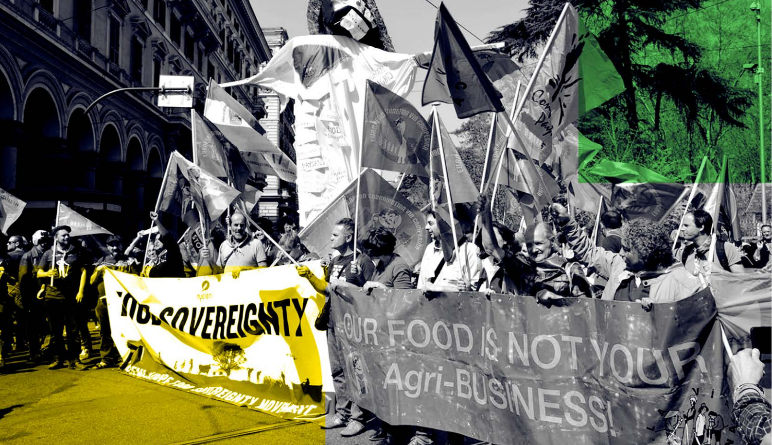
60 años de la PAC, Roma, 2017